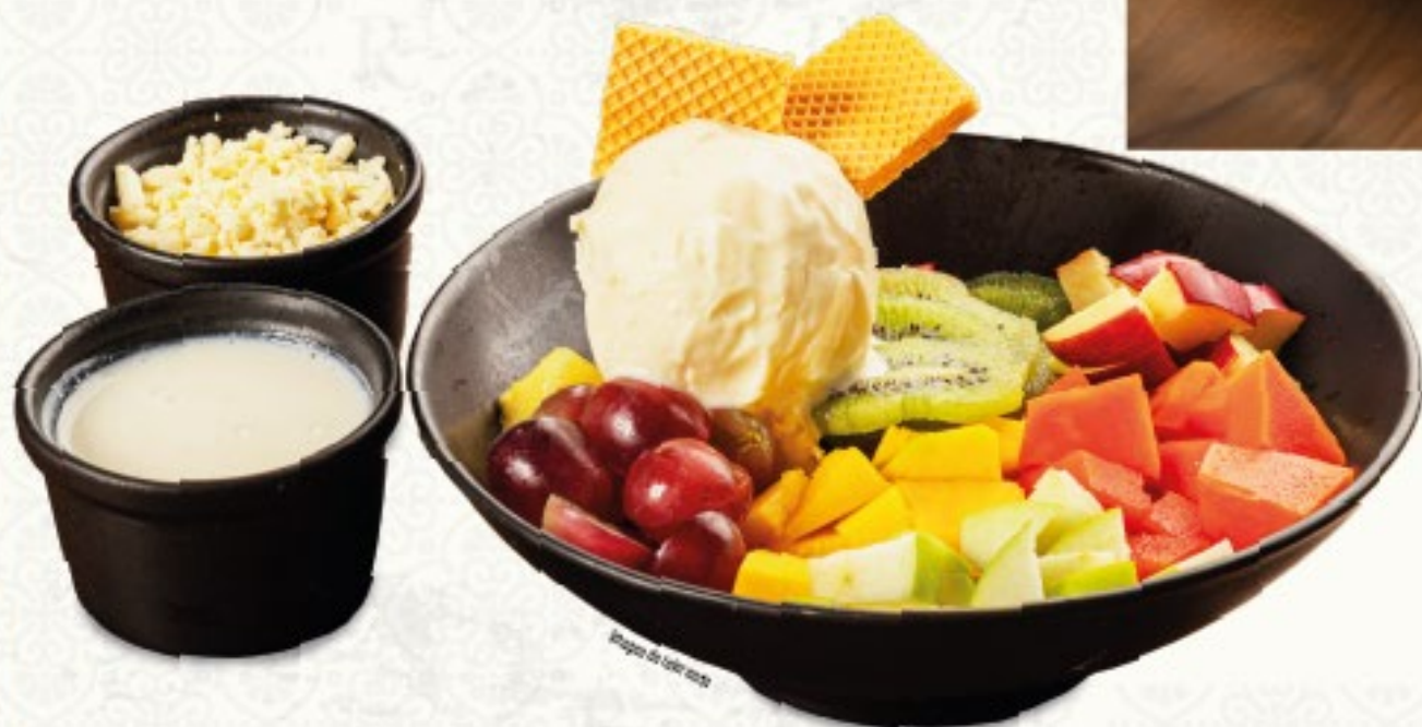
Imagen de referenc