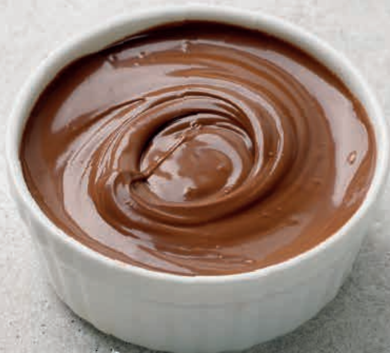
imagen de referencia