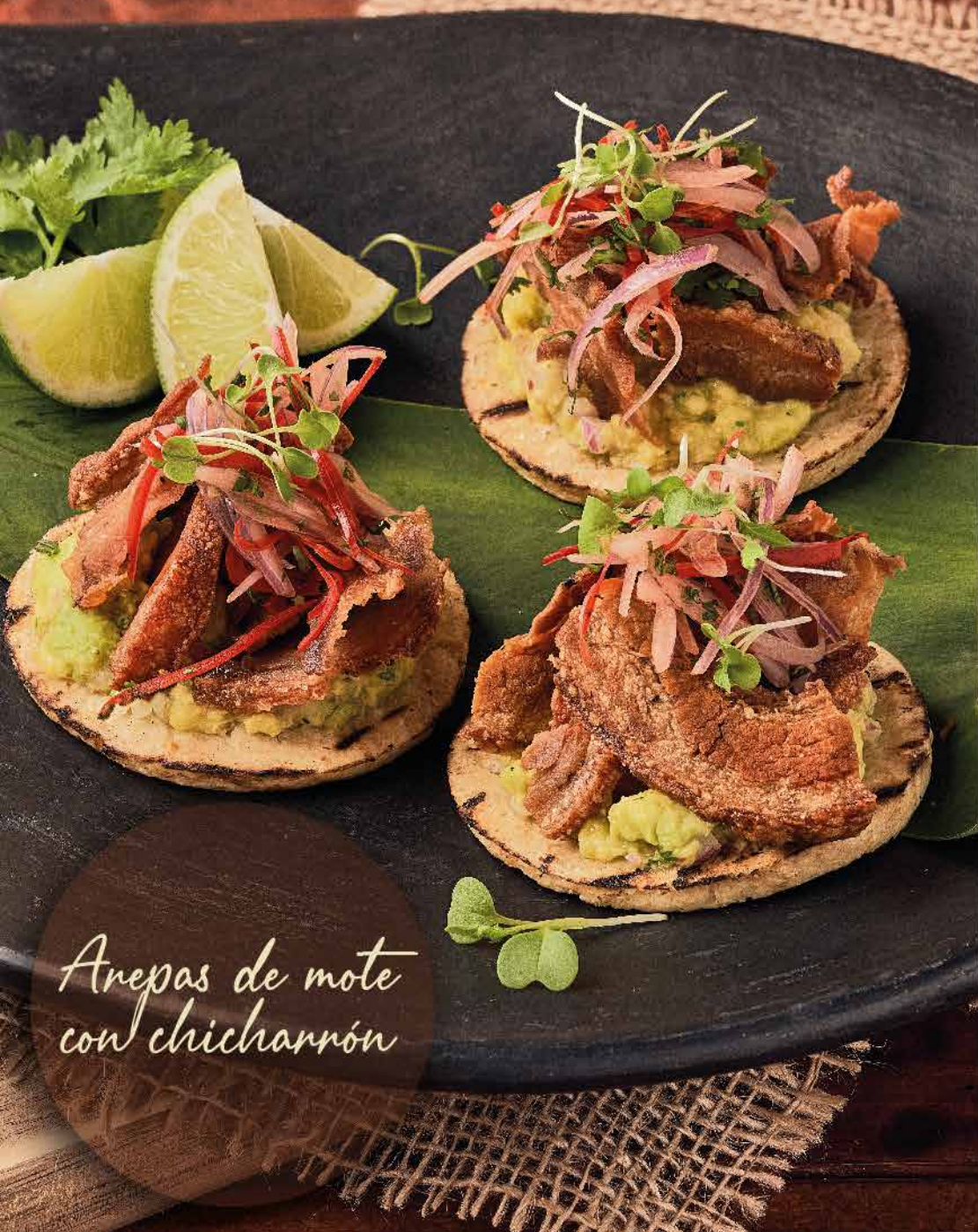
Arepas de mote con chicharrón