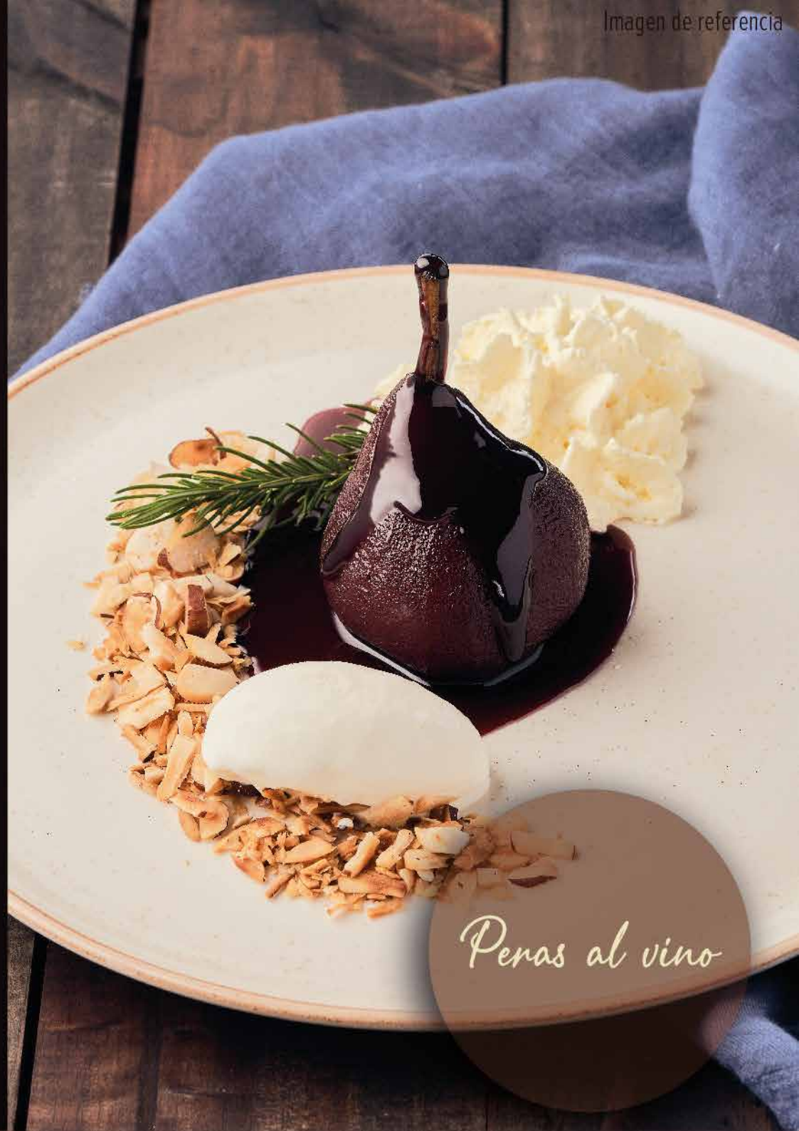
Peras al vino